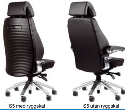
S5 med ryggskal