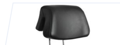
Appuie-tête Comfort 6 directions