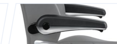
Accoudoirs relevables Svenstol®

Pour plus d'options d'équipement, veuillez consulter la fiche de données produit et la fiche des accessoires.