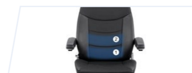
Soutien lombaire pneumatique