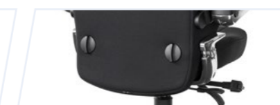
Soutien lombaire mécanique