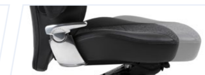
Réglage en profondeur de l'assise