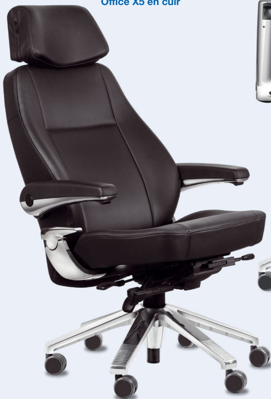
Office X5 en cuir