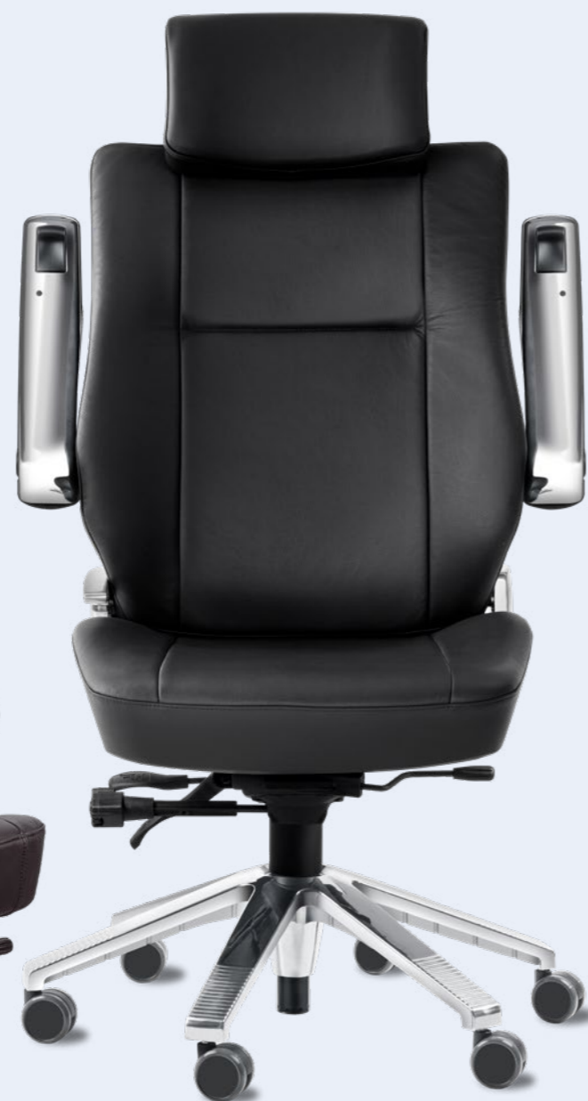
Office X6 en cuir