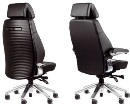
S5 avec coque de protection du dossier