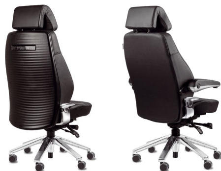
S5 avec coque de protection du dossier