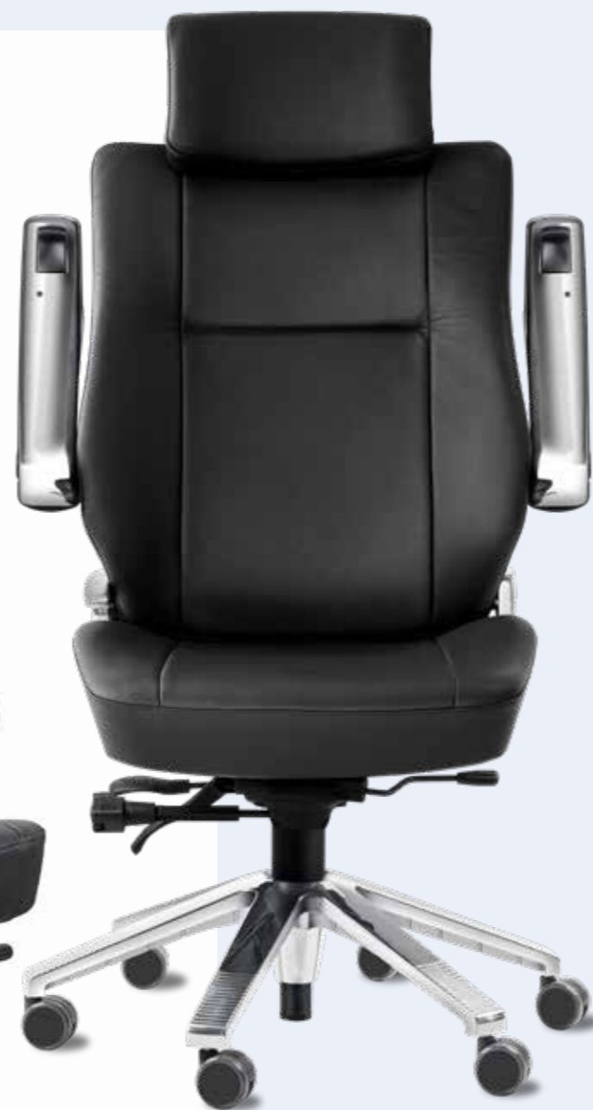
Office X6 i läder