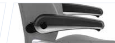
Svenstol ® -Armstöd

Ytterligare alternativ finns i produktdatabladet och i översikten över våra tillbehör.