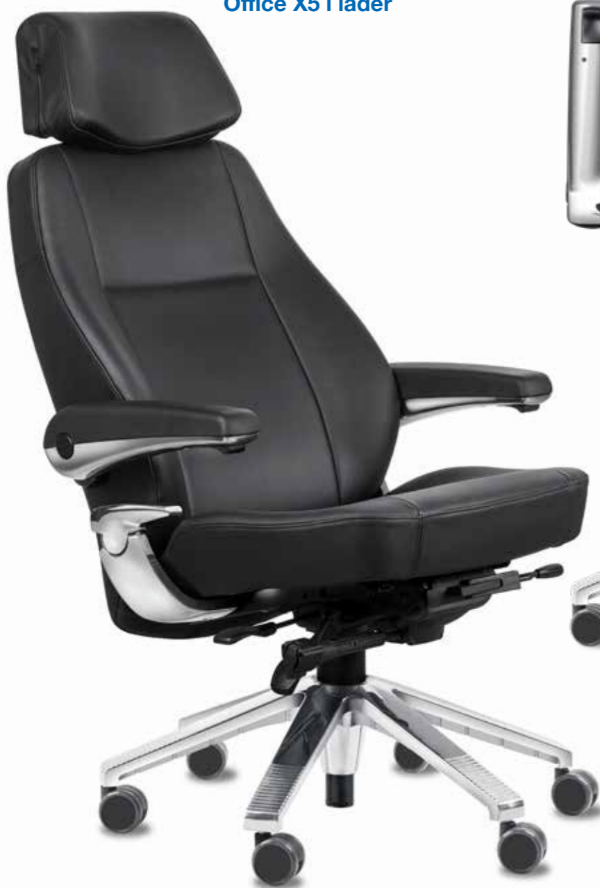
Office X5 i läder