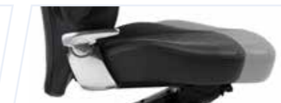
Justering av sittdjup